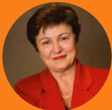
Kristalina Gueorguieva DIRECTOR INTERNATIONAL MONETARY FUND