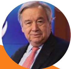
António Guterres SECRETÁRIO GERAL DAS NAÇÕES UNIDAS