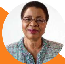
Graça Machel FOUNDER GRAÇA MACHEL TRUST