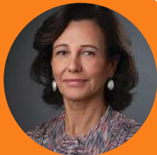
Ana Botín CHAIRWOMAN SANTANDER GROUP